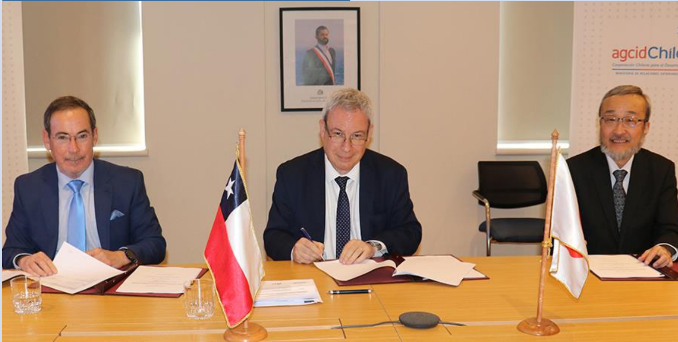
Firma con Japón del proyecto Kizuna 2.