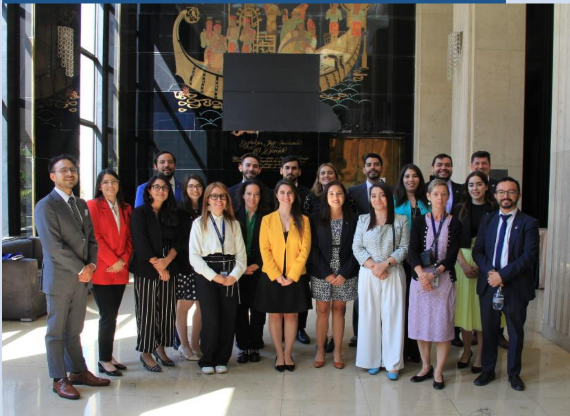
Fortaleciendo el plan formativo de la Academia Diplomática.