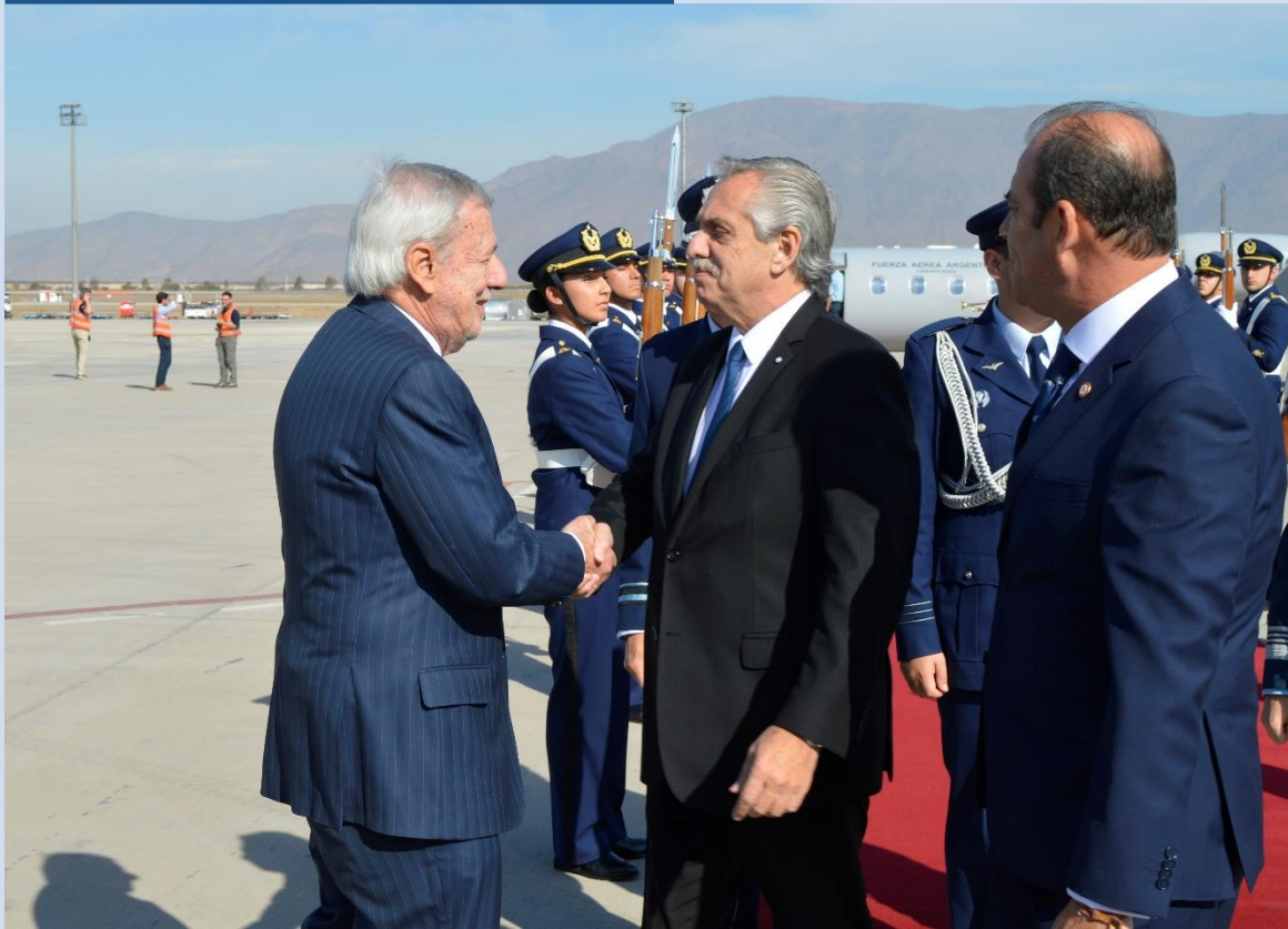
Visita del Presidente de la Argentina Alberto Fernández.