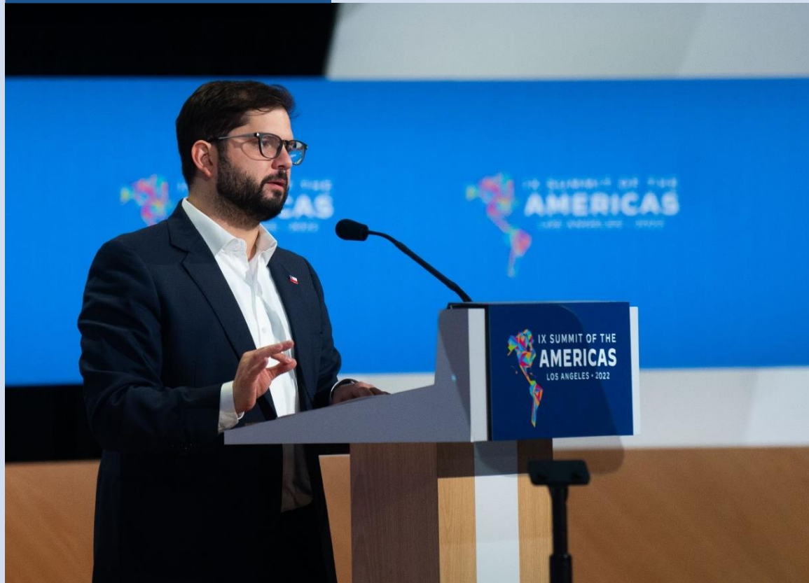
IX Cumbre de las Américas.