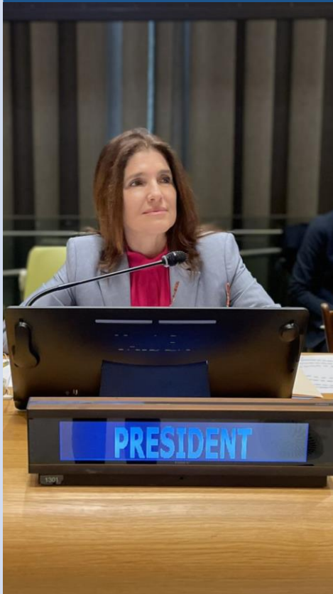
Mujeres en la diplomacia.