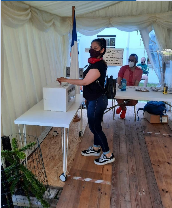
Voto en el exterior.