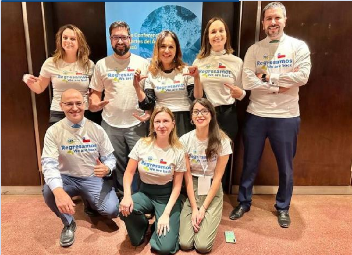
COP2, Acuerdo de Escazú.