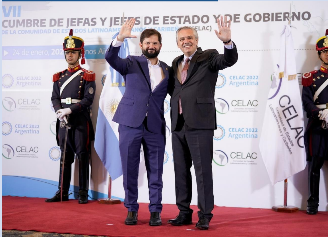
VII Cumbre Comunidad de Estados Latinoamericanos y Caribeños (CELAC).