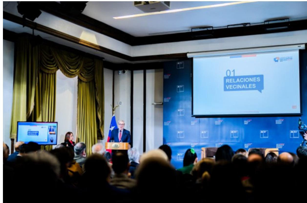
Imagen 5: Evento Presencial

Asimismo, finalizado el plazo para recibir opiniones, con fecha 24 de junio fue cerrado el formulario electrónico. A la fecha de cierre no se recibió ninguna pregunta por parte de la ciudadanía.