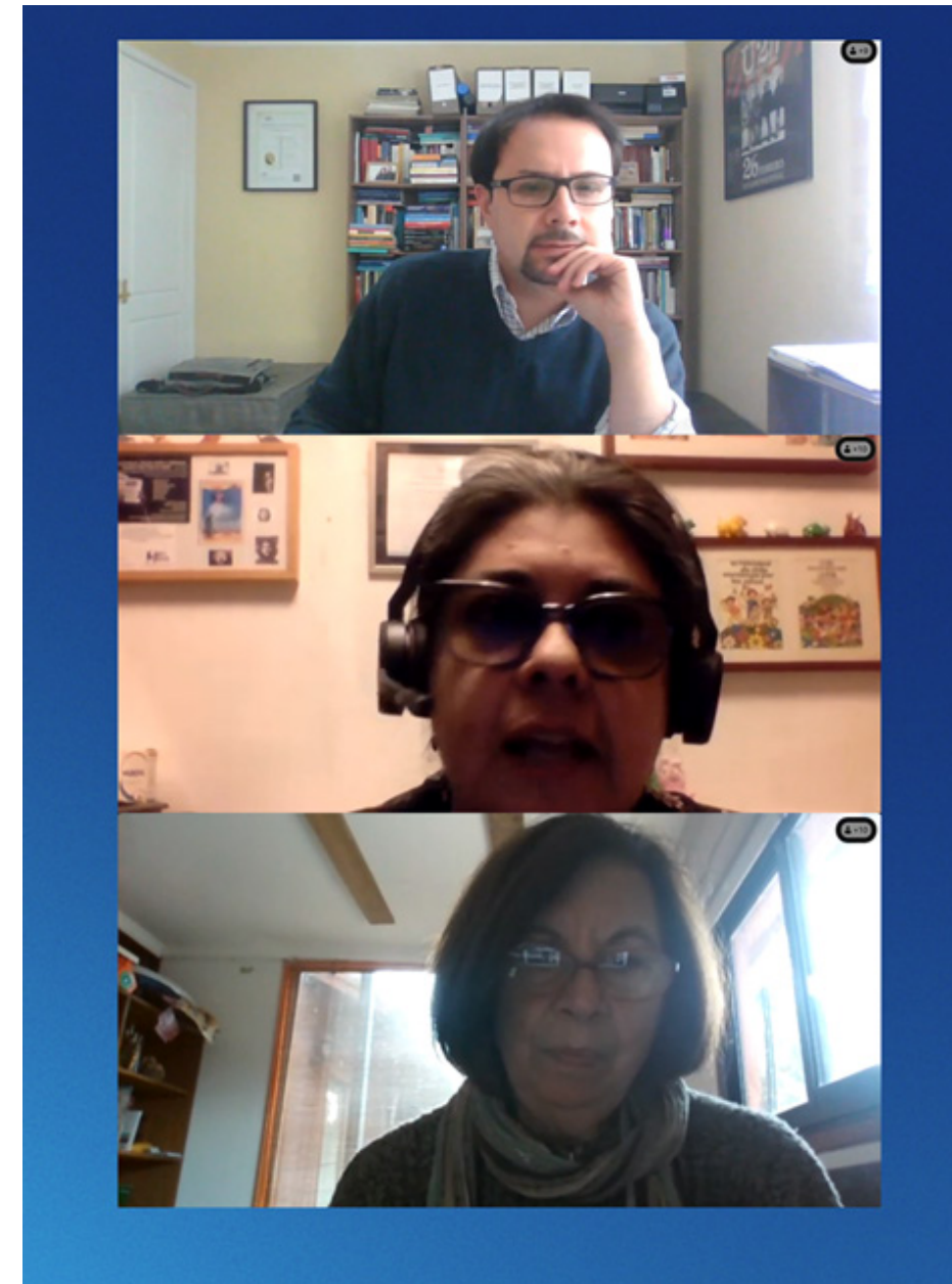
Imagen 2: Sesión Extraordinaria del Consejo de Sociedad Civil donde se aborda Cuenta Pública Participativa.

El día 23 de abril se pone a disposición de los consejeros del Consejo de la Sociedad Civil de la Subsecretaría de Relaciones Exteriores, el primer documento borrador de la Cuenta Pública 2023 - 2024. El día 29 de abril de 2024 a las 16:00 horas, los miembros del Consejo de la Sociedad Civil, durante la Sesión Extraordinaria, realizaron observaciones al borrador del documento de la Cuenta Pública, las cuales fueron acogidas e incorporadas en el documento final