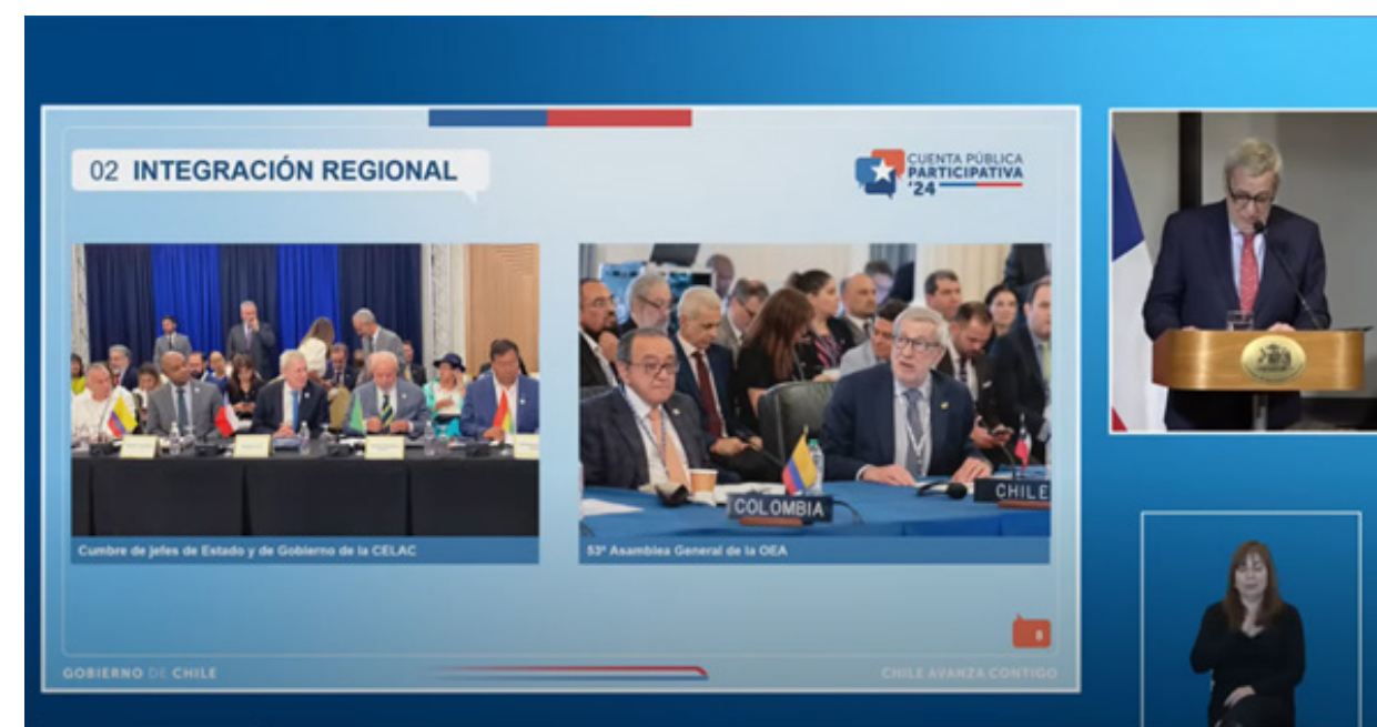
Imagen 4: Transmisión oficial