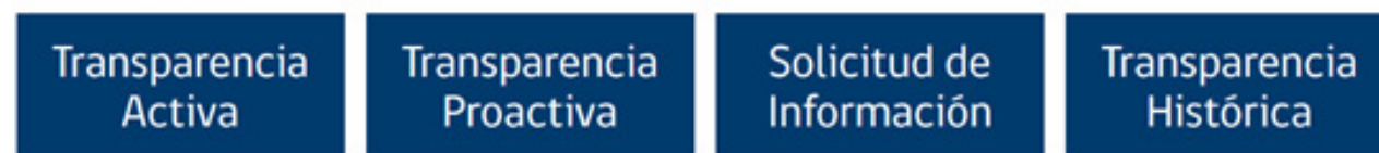
Imagen 1: Banner Página web

El día 23 de abril se pone a disposición de los consejeros del Consejo de la Sociedad Civil de la Subsecretaría de Relaciones Exteriores, el primer documento borrador de la Cuenta Pública 2023 - 2024. El día 29 de abril de 2024 a las 16:00 horas, los miembros del Consejo de la Sociedad Civil, durante la Sesión Extraordinaria, realizaron observaciones al borrador del documento de la Cuenta Pública, las cuales fueron acogidas e incorporadas en el documento final